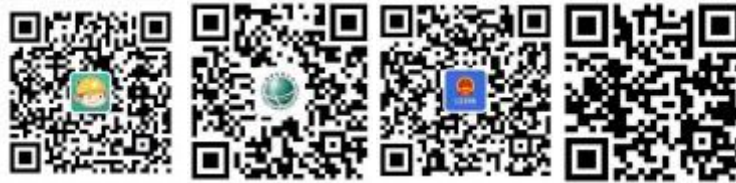
浙江电力公众微信

您可以关注公众微信“国网浙江电力”(sgcc-zj)、网上国网 APP、公众微信“12398 能源监管热线”、“12398 能源监管热线”APP。